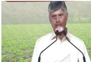
అవుతుంది"అని సీఎం చంద్రబాబు తెలిపారు.

రాయవరం: కరోనా నవయంలోనూ రైతులు పనిచేసి అందరికీ ఆస్తి పెట్టారని ఏపీ సీఎం చంద్రబాబు అన్నారు. తూర్పు గోదావరి జిల్లా రాయవరంలో వర్షానికి వీలైన సీఎం చంద్రబాబు.. రైతులకు వట్టూరారు పానుపుద్దకాల పంపిణీ కార్యక్రమంలో పాల్గొని మాట్లాడారు. రైతుల భూమి ప్రకారం జగన్ ఫోలో ఎందుకు చేశారో అర్థం కాకపోయింది. గత ప్రభుత్వ నేతల ప్రమాదకరమైన ఆలోచనలని.. 'మీ హక్కు' అని ఎన్నకల ప్రచారంలోనే తాము చెప్పినట్లు గుర్తు చేశారు. రాజమండ్రి వేసి పానిటేబిలు ఇప్పించిన హామీ ఇచ్చామని, దాన్ని ఇప్పుడు నెవ్వరూ పనిచేయలేదని తెలిపారు.